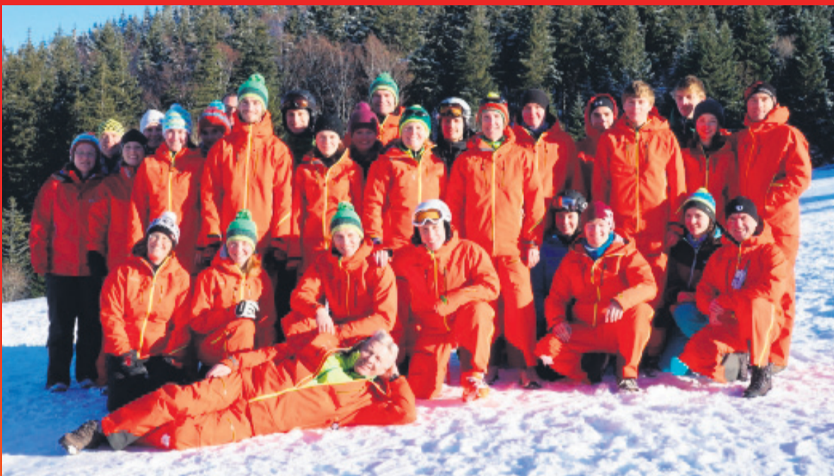
Die Skisaison 2016/2017 wird großartig – das Skilehrerteam von Ski-Kirchzarten hat ein tolles Programm zusammengestellt und freut sich auf den Saisonstart.